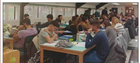
OCCUPACIÓN BIBLIOTECA DICIEMBRE