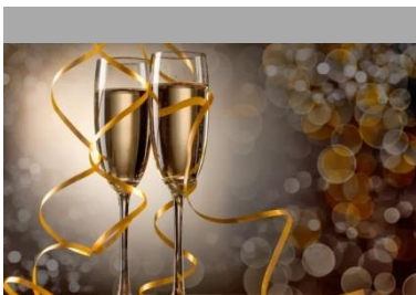
COPA DE NAVIDAD EN LA BIBLIOTECA