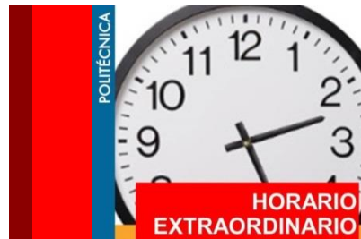
HORARIO BIBLIOTECAS UPM