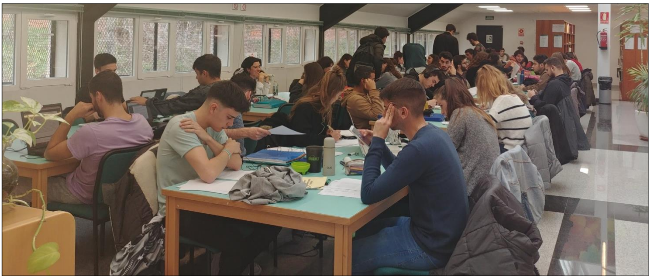
Biblioteca Edificio de Montes