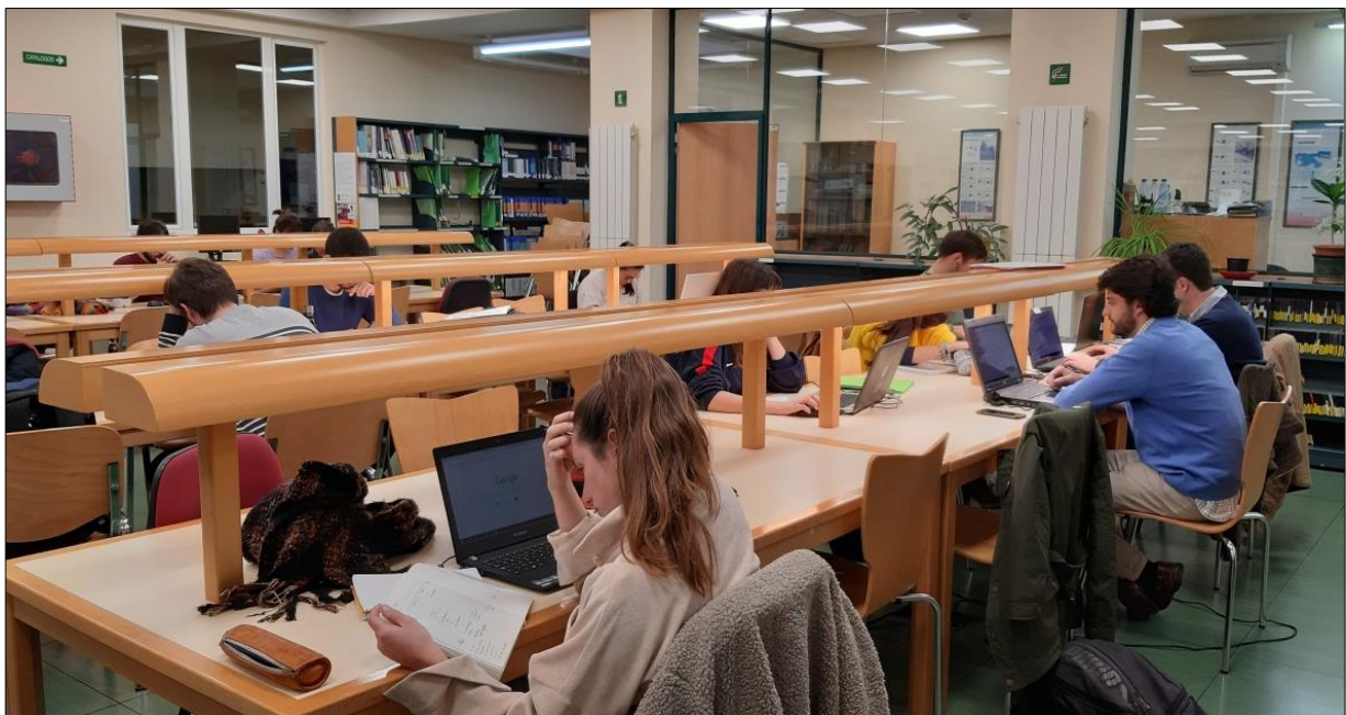
Biblioteca Edificio de Forestales